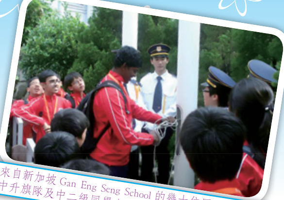
來自新加坡 Gan Eng Seng School 的幾十位同學，與鄧中升旗隊及中二級同學交流心得。