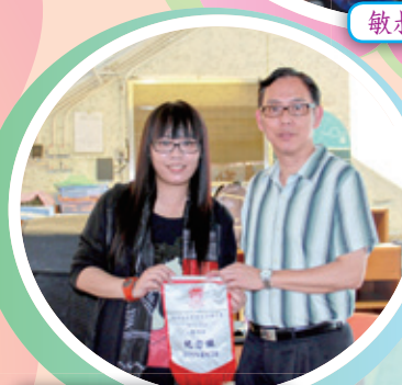
曾副校與蕭老師留影