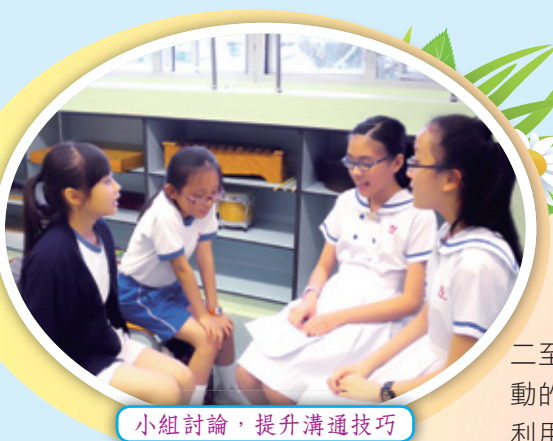
小組討論，提升溝通技巧

學生大使在本學年初成立，成員來自二至五年級的同學，他們肩負著推廣學校活動的責任。學生大使透過每周的活動，學習利用廣東話、英語及普通話提升人際溝通、演說技巧和談話的禮儀，從而在活動中培養學生的責任感及領袖才能。本年度學生大使在聖誕親子嘉年華中初試啼聲，為來賓作導賞，介紹學校的歷史及設施；另外，學生大使協助圖書科以廣播形式宣傳世界閱讀日的活動，及在幼稚園到校參觀期間充當嚮導。盼望在未來的日子裏，學生大使能夠有更多機會實踐他們所學到的理論。