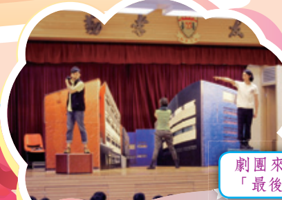
劇團來表演話劇——「最後的勝利」