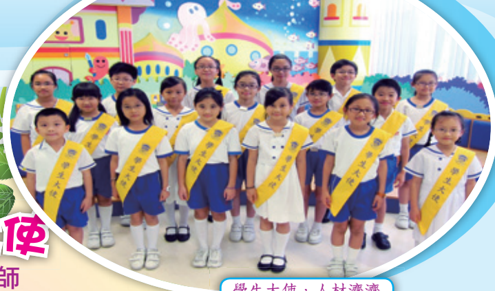
學生大使，人材濟濟