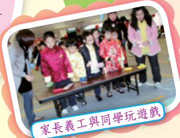
家長義工與同學玩遊戲