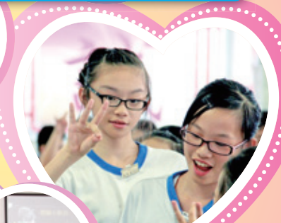
5A 班練習造手，有板有眼。