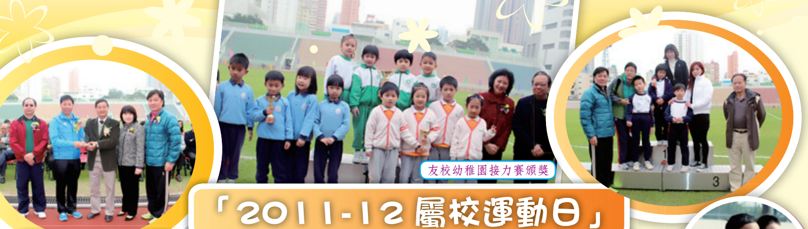
友校幼稚園接力賽頒獎