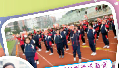
揮動運動帽歡送嘉賓