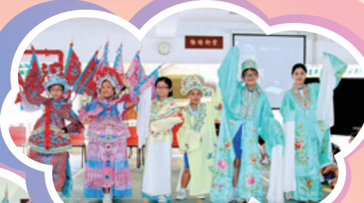
同學的文武生及花旦扮相多神似