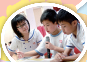
P5 班際大比拼——必答題