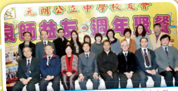
會長、嘉賓、理事、各校校長、家教會主席大合照。