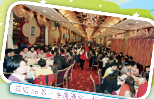
筵開 56 席，喜慶滿堂，場面熱鬧。

傳真：2442 2596 會所電郵：ylpms2003@yahoo.com.hk