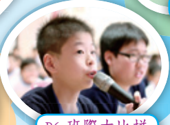
P6 班際大比拼——搶答題