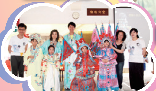
粵戲劇導師、同學和老師大合照。