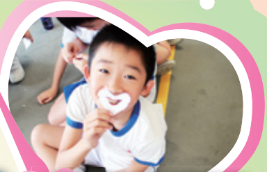
原來笑容也可以撕出來的