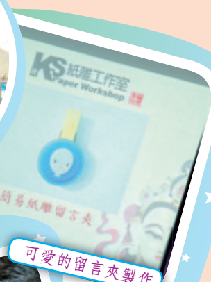
可愛的留言夾製作