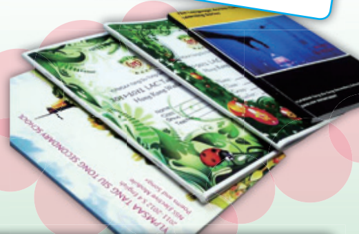
鄧中老師絞盡腦汁，令同學得到最適切的學習材料。