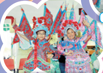
5P 班同學的武生扮相，維妙維肖。