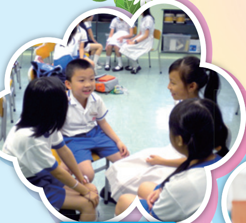
清楚說話，用心聆聽