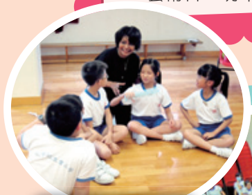
老師做動作，同學輪流猜猜是什麼。