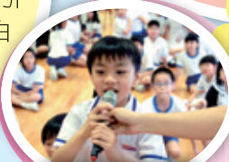
P4 班際大比拼——打氣題

今年的數學週有兩個環節：「跟你做個 friend」和「班際大比拼」，兩個也很好玩。當中有份代表我班參加班際大比拼，戰況相當激烈，我班在比賽中反敗為勝，十分開心。數學週不但能引起同學們對數學的興趣，還使我們明白遇到難題時，不要放棄，要多作嘗試，才能找出正確的答案。