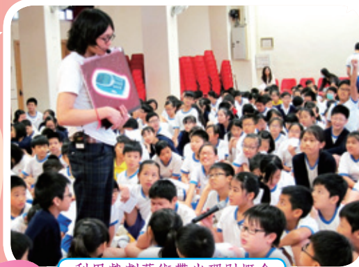
利用戲劇藝術帶出理財概念