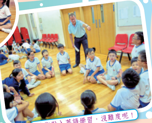
藝術融入英語學習，沒難度呢！