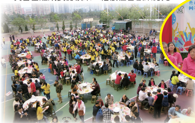
校友會辦學25周年紀念盆菜宴

3月15日假元朗喜尚嘉喜酒樓舉行了周年慶祝晚會，當晚筵開五十多席，各方友好共聚一堂，分享元中校友會茁壯成長的碩果，緬懷往昔歡樂時光。