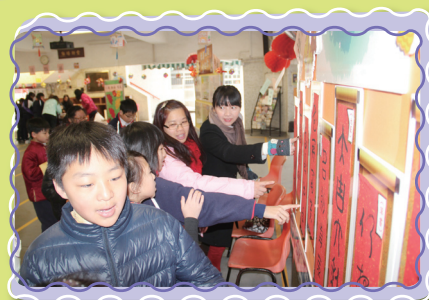
努力分辨中國字體，加油！

「齊慶元宵佳節，華服日樂趣多」華服日大追蹤！所有同學全力到各個攤位完成任務——集齊提示字，合作尋寶，真不簡單！大家在華服日盡情遊玩中，學習到不少中華文化：服飾、飲食、古蹟、字體、「歲寒三友」與年獸的故事。同學還在禮堂進行普通話比賽，一展才藝。