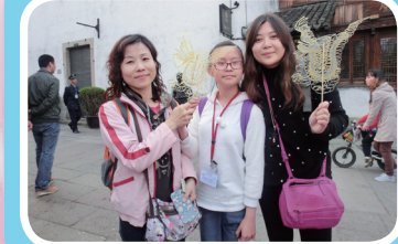
我們手執由麥芽糖拉製而成的飛龍，於月河古鎮留影