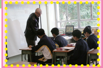
第一屆優秀新生參加英語寫作班

為加強對尖子的栽培，本學年鄧中創辦了「優秀新生培訓計劃」，於四年內重點訓練學生兩文三語的應用能力。首屆中一學員現正接受週末英語寫作及演說課程，由特聘的資深外籍導師悉心指導。完成課程後，校方將安排全體學員出國遊學兩至三星期，讓其實踐所學，鞏固英語基礎。