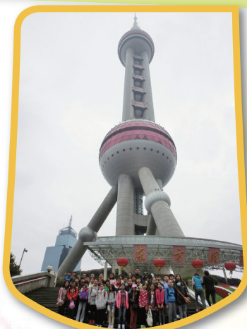
上海著名景點——東方明珠塔