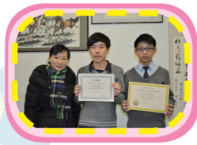
本年度鄧中推薦多名學生參加國際英語試，如IELTS、TOFEL、TOEIC等，屢獲佳績。