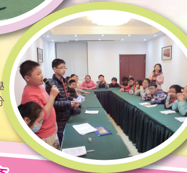
與英業小學一起進行分享會