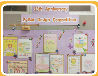
英文科慶銀禧海報設計比賽