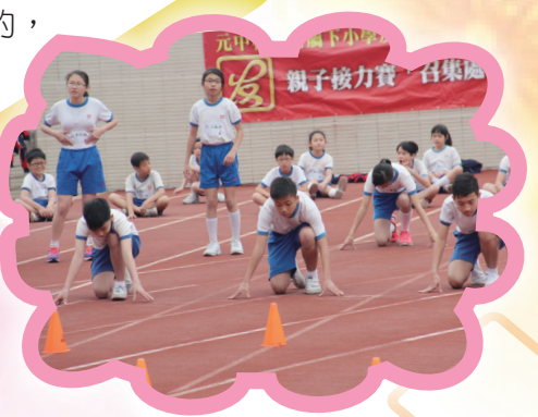
一百米男飛人的誕生