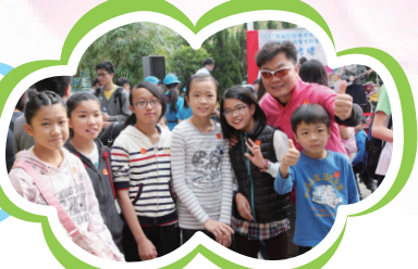
校長與同學齊齊參與