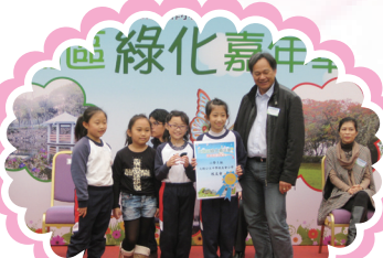
元朗區綠化嘉年華—花卉拼圖比賽今年再奪團體亞軍