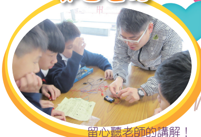
留心聽老師的講解！