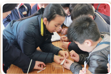
指導學生製作竹蜻蜓