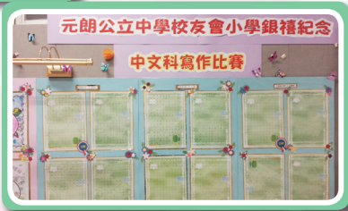
慶銀禧中文寫作比賽