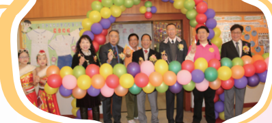
簡單而隆重的剪綵儀式——為25週年時間廊揭幕