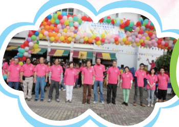
籌備多時的「25週年慶銀禧步行籌款」，終於起步了