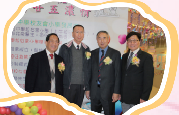
點點集體回憶，滿滿廿五濃情 -- 創校校監、現任、未來校監與陳校長合照