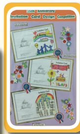
設計具特色的邀請卡