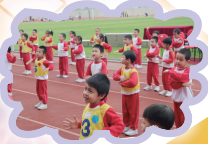
活潑的幼稚園同學做早操