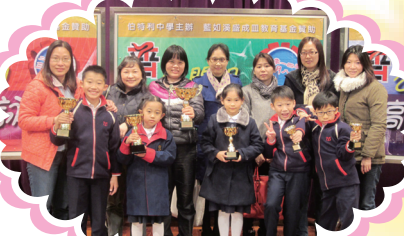
朗誦組在屯元區小學生普通話才藝比賽贏得全場總冠軍，可喜可賀！