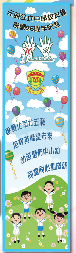
廿五週年慶銀禧橫額

此外，各科組亦舉行了多項慶銀禧的活動，如填色比賽、中英文寫作比賽、舊曲新詞親子創作比賽等，容後還有慶銀禧數學攤位遊戲及聯校畢業禮(閉幕典禮)，為廿五週年校慶添上姿采。