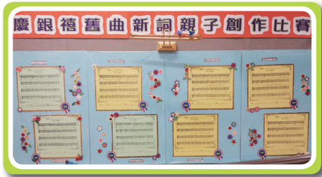
「悠悠時光轉，轉眼到現在……廿五情常在，心裡齊互勉」-- 不簡單的小作曲家

慶銀禧中文寫作比賽—深情的作品—「美麗」蘊含著溫暖的意味，我就生活在這「美麗的校園」