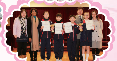
於鄧中舉辦的英文講故事比賽同時獲團體亞軍及最佳聲線獎