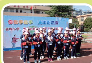
我校同學於上海新城小學表演