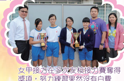
女甲接力在多次友校接力賽奪得獎項，努力練習果然沒有白費