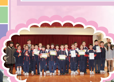
鄧中及伯特利數學比賽