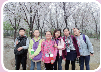
顧村公園的櫻花林令人仿如置身日本

一到達上海，我們便與上海浦東新區新城小學進行交流活動。他們熱情的款待，認真投入的精神和精彩的表演，令我們深受感動，明白到一刻的友誼也是十分珍貴。而且，我們也在與同學同桌吃飯時，學習到用餐的禮儀，明白到與人溝通相處應有的態度。 這次的旅程既刺激、豐富，又能與當地的同學建立友誼，真的令我們難忘不已。