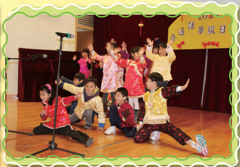
普通話才藝表演中施展渾身解數