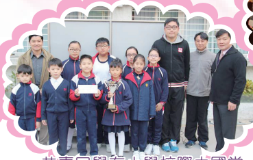
恭喜同學在小學校際中國常識競技比賽中獲得亞軍