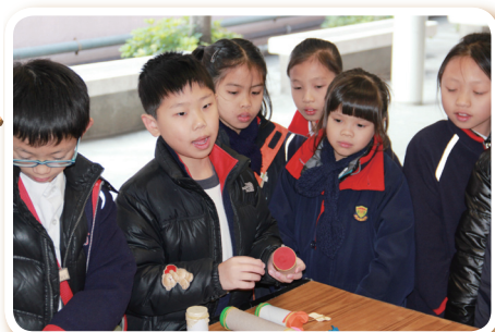
常識小百科組員講解聲音炮的原理