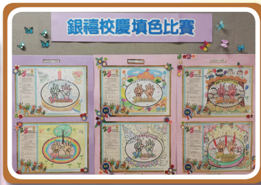
慶銀禧填色比賽--設計精美、色彩繽紛的得獎作品