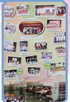
時光倒流 25年--25週年時間廊