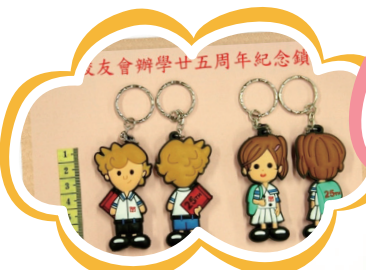
廿五週年紀念鎖匙扣