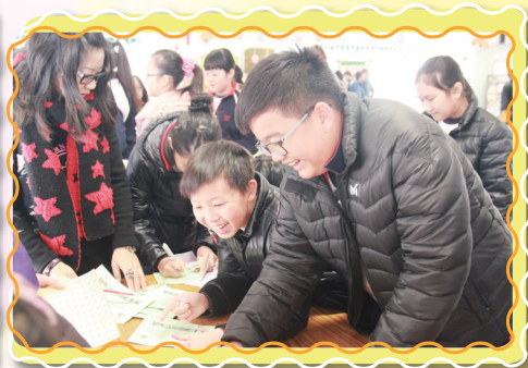
樂在「歲寒三友」中尋寶