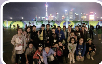
上海美麗的夜景令人難忘

我們最喜歡鐵哥們機器人主題公園，內裏展示了很多不同的機械人，有變形金剛、阿凡達等。真想不到一些廢銅爛鐵，竟可以製作成一個煥然一新的機械人，既環保又有創意，令人佩服。 印象最深刻的，是我們在月河古鎮遊覽。那兒古色古香，充滿了民間玩意，如麪粉人偶、麥芽糖拉糖等，令我們十分興奮。而且，當晚我們與英業同學進行分享會，大家細說連日來的樂事和經歷，加深了彼此的感情。