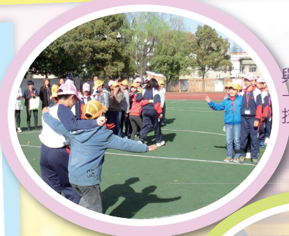
與上海學生一起進行競技比賽

我們最難忘的，是登上東方明珠塔。起初，大家都不敢踏上明珠塔觀賞層的玻璃地板，害怕會掉下去。後來，當我們鼓起勇氣，嘗試了第一次後，就不怕了。這令我們明白到要勇於嘗試，才能克服困難。 在顧村公園欣賞櫻花時，我們仿如置身日本，想不到上海也有這樣的美景。而且，我們在民俗文化館裏體驗了各國的文化，例如：歐洲的建築風格，中國的生活習慣，東南亞的風土人情……真的獲益良多。 此外，參觀民防科普博物館讓我們增加對天災和人為災禍的意識，認識到不同的逃生方法，對我們來說，是很新鮮的體驗。