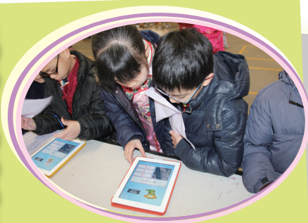
正投入運用平板電腦學習