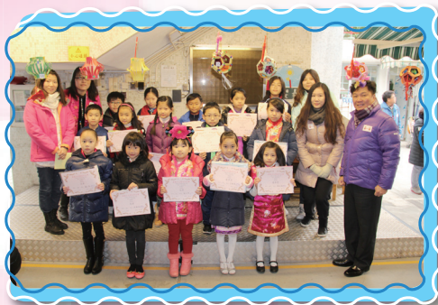
恭喜花燈設計比賽獲獎同學