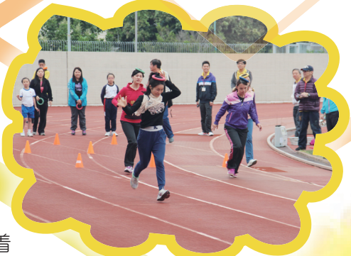
母親組親子接力賽

於2014年3月20至21日在元朗大球場順利完成所有賽事及頒獎典禮，一、二年級的同學在競技遊戲時表現興奮，大家都希望爭取勝利，為自己班別奪得榮譽。隨着就是各班都想問鼎的班際接力賽，相信六年級的同學特別緊張，因為這是他們小學階段最後的一個運動會了。校長邀請了十多間友好幼稚園參加四乘二十五米的接力賽。他們也是訓練有素的，全場所有嘉賓及同學都為他們喝采。最後，我們很榮幸邀請到鄧兆棠中學潘校長蒞臨主禮頒獎，她的教誨為同學帶來了很多啟發，而運動日亦在一片歡樂聲中完結。