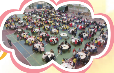
陣容鼎盛的盆菜宴--步行完畢，大家齊齊享用香噴噴的盆菜