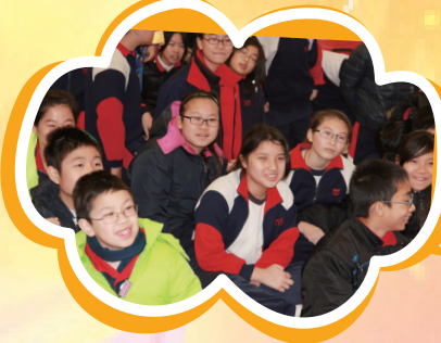
同學全神貫注參與普通話遊戲