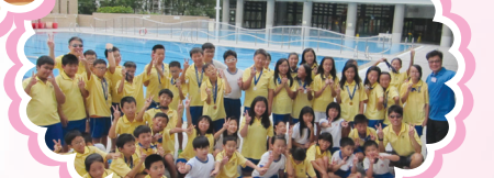
元朗區校際水運會再奪佳績