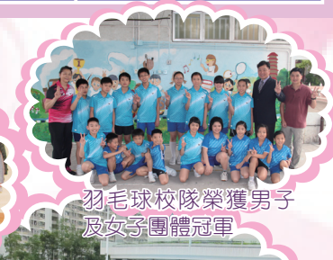
羽毛球校隊榮獲男子及女子團體冠軍