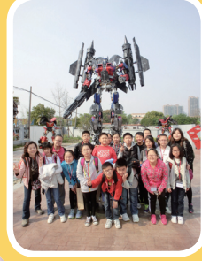
鐵哥們機器人主題公園內有很多用廢鐵造成的變形金剛模型，令人大開眼界